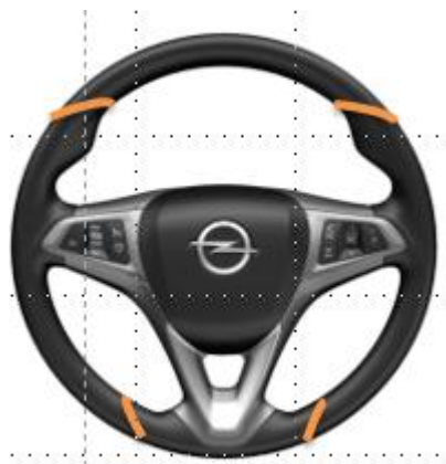
RP2017 – kierownica N34 z wyświetlaczem UDD