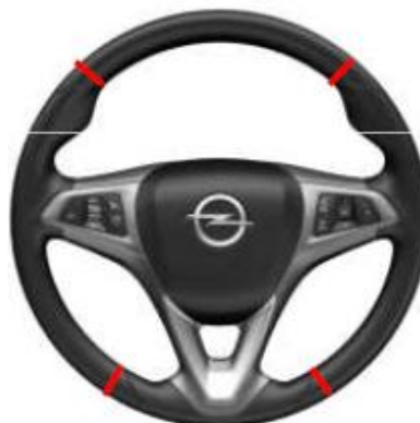
RP2017 – kierownica N34 z wyświetlaczem UDC